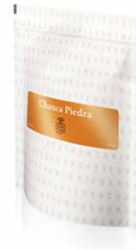
100g Chanca Piedra

Účinky a obsahové látky: Chanca Piedra má diuretické, spazmolytické a protizánětlivé účinky. Uvolňuje hladkou svalovinu specifickou pro močový a žlučový trakt, což podporuje přirozené vypuzení kamínků a regeneraci. Napomáhá při poruchách trávicího traktu, průjmu, zácpě nebo nadýmání, posiluje funkce jater. Snižuje krevní tlak. Nat' obsahuje především chinolizidinové alkaloidy, flavonoidy (rutin) a taniny.